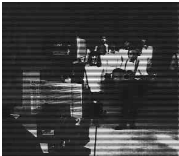
Negli studi di Rete7 (l'odierna èTV)