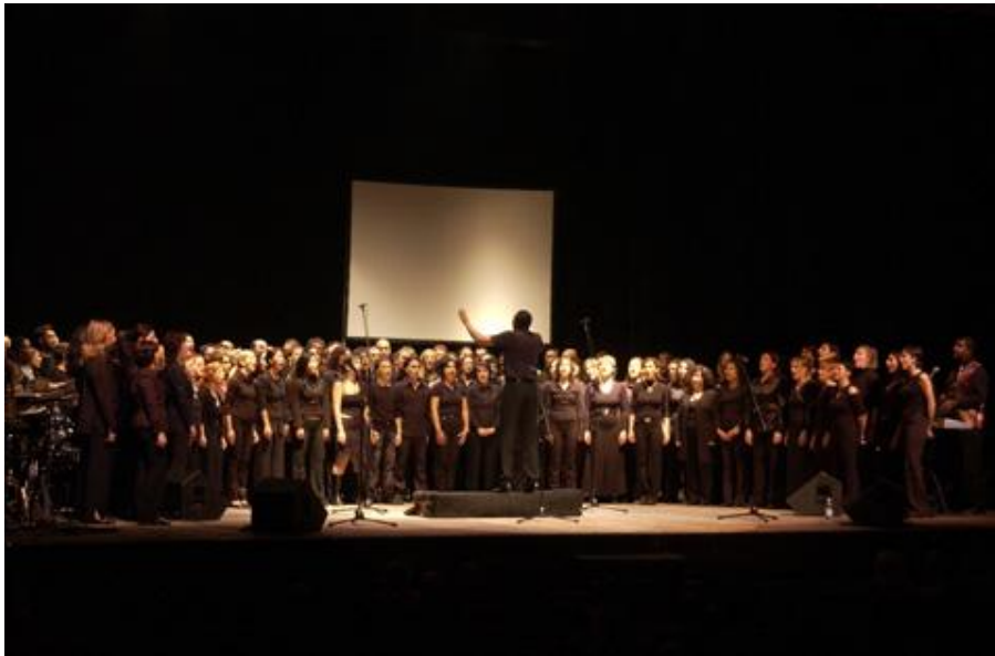
Gospel Connection 2003 concerto al Teatro delle Celebrazioni