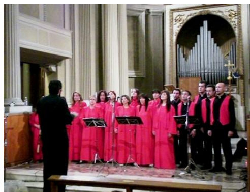
Chiesa di S. Ruffillo

Cambia anche la divisa che richiama quella dei cori gospel, ma non è propriamente una copia degli abiti che vengono usati nelle chiese americane.