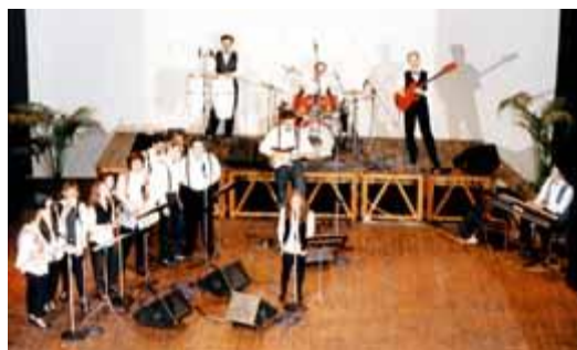
1995 Concerto al Teatro di Budrio (BO)