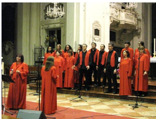
Basilica di S. Domenico (B.L.A.C.K.)