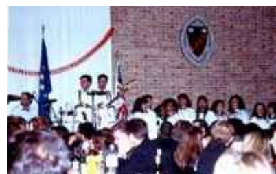
1993 Concerto alla John's Hopkins University