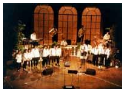
1993 Concerto al Teatro Comunale di Budrio (BO)