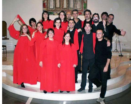
Chiesa di S. Luca (S.Lazzaro)

Al ritorno a Bologna, con molto entusiasmo, vengono affrontati altri nuovi brani che con un po' di... incoscienza e coraggio presentiamo al nostro primo concerto in dicembre. Sembra passato talmente tanto tempo dall'ultimo concerto che risale solo al 2003!