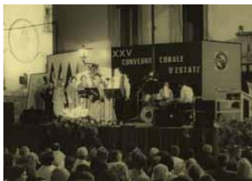
Concerto in Lunigiana (Aulla 1997)

ed è servita per consolidare in maniera determinante il lavoro svolto nei due anni precedenti.