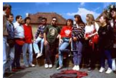
1993 Relax al Ponte Carlo a Praga

Il 1995 ci vede ancora impegnati, tra l'altro, in una rassegna internazionale di musica corale al Castello di Caldonazzo (Tn), e vede nascere un forte dibattito interno sull'impronta da dare al gruppo, sul piano artistico e dei rapporti personali.